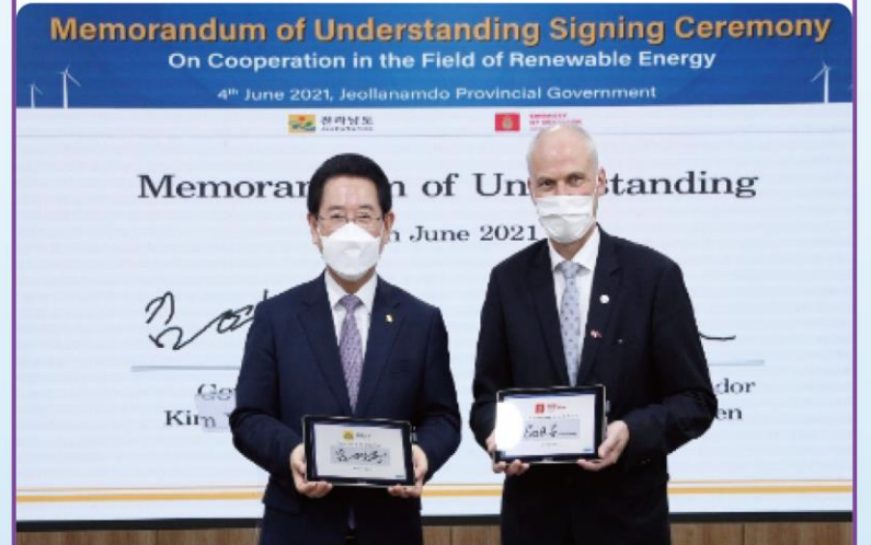
全羅南道-ベスタスMOU締結