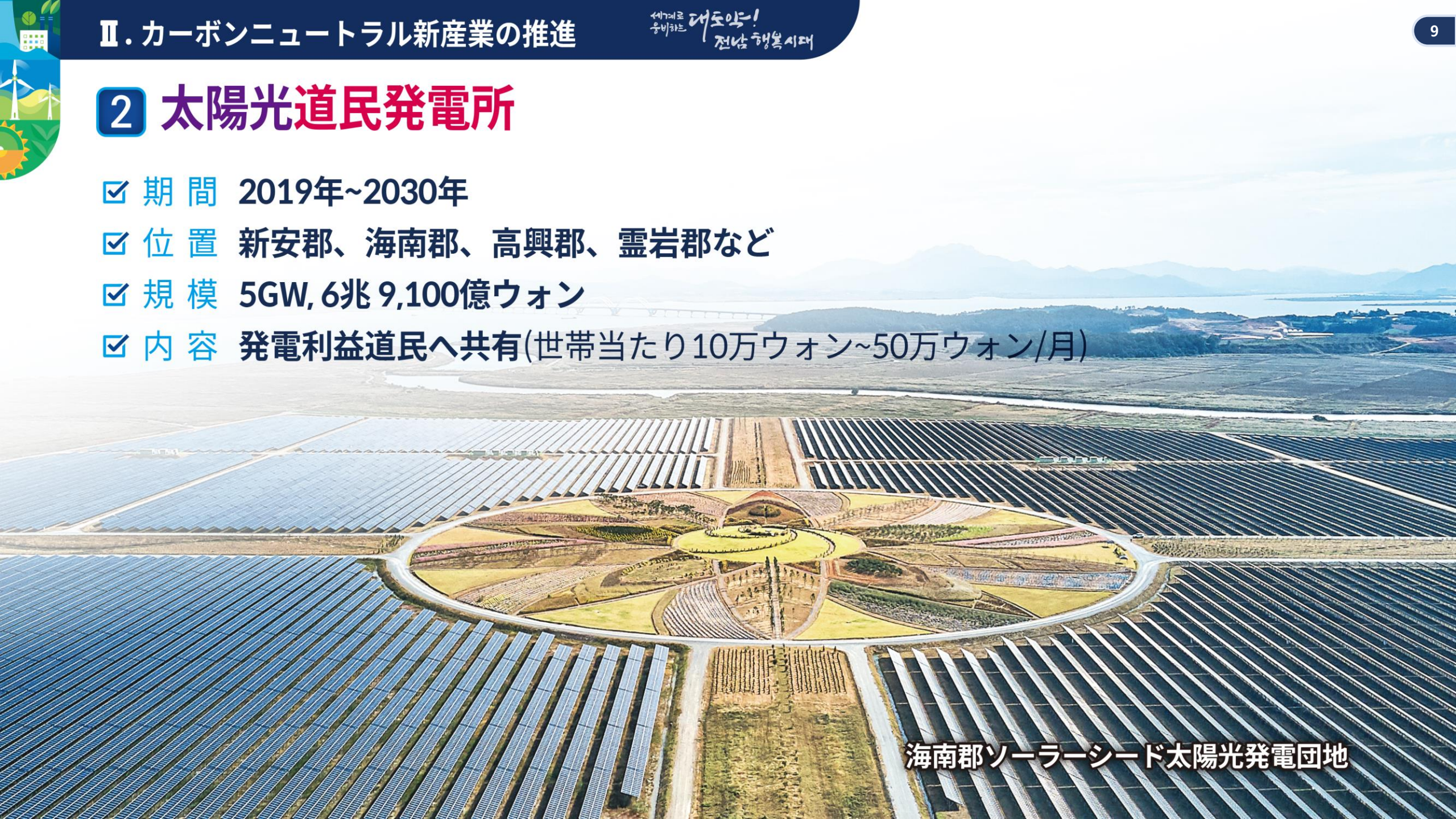
海南郡ソーラーシード太陽光発電団地