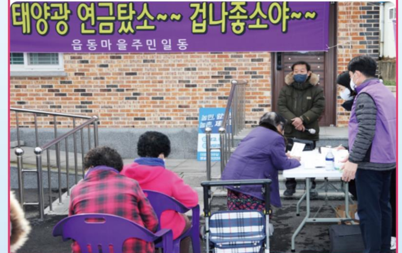
太陽光発電利益金配当(新安郡安佐面)