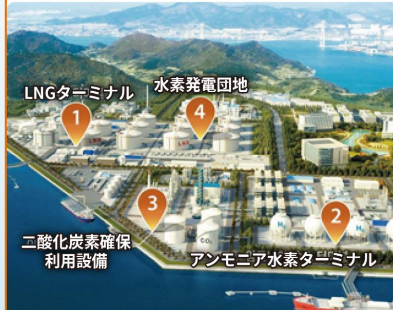
麗水猫島エコエネルギーハブ