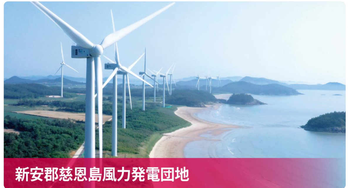
新安郡慈恩島風力発電団地