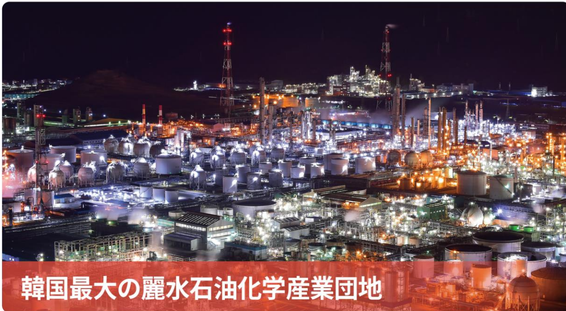
韓国最大の麗水石油化学産業団地