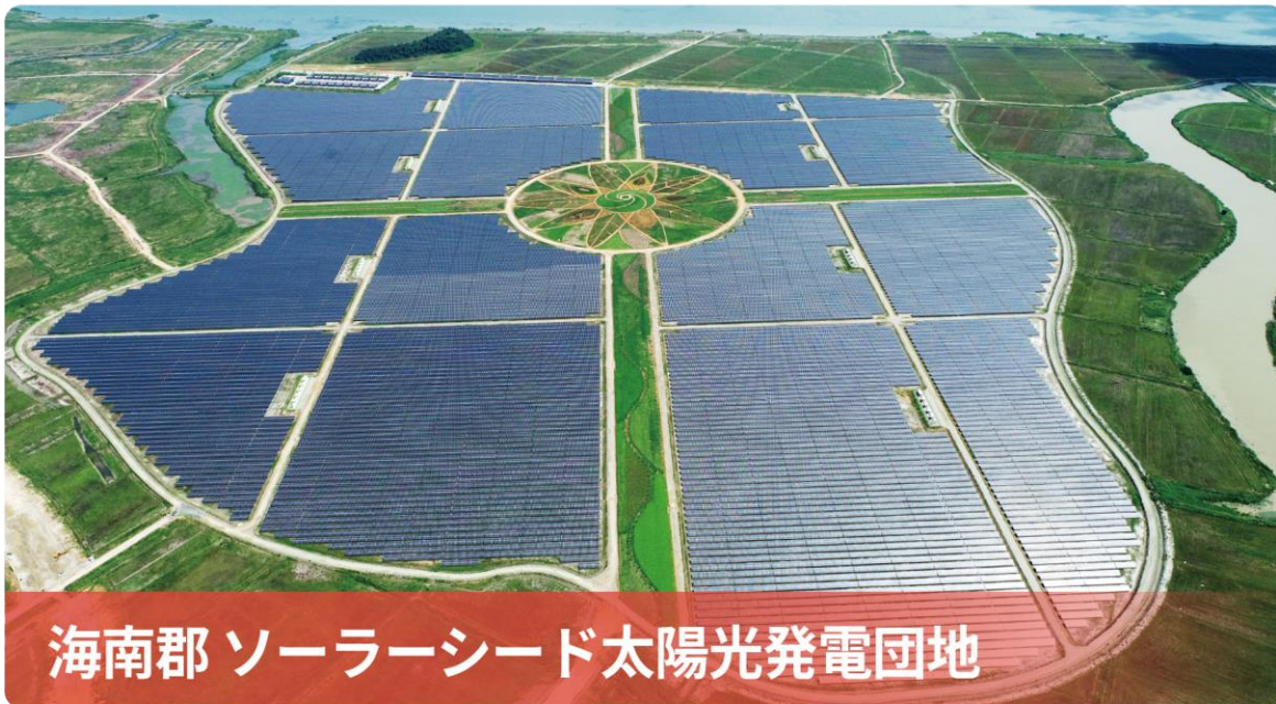
海南郡 ソーラーシード太陽光発電団地