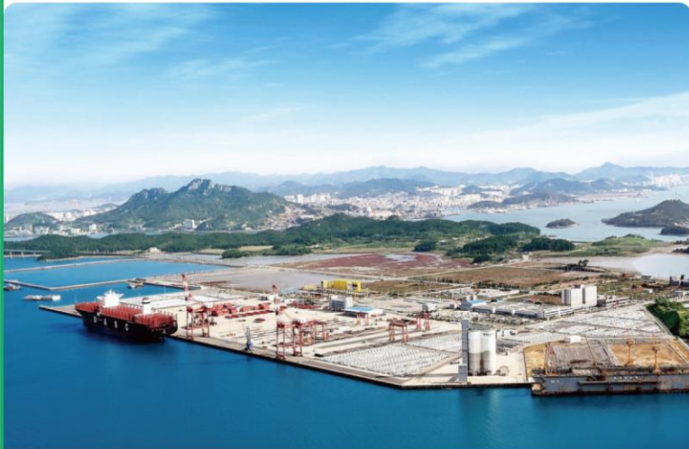
木浦新港及び後背地