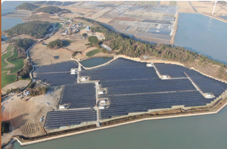
新安郡智島邑 太陽光発電団地