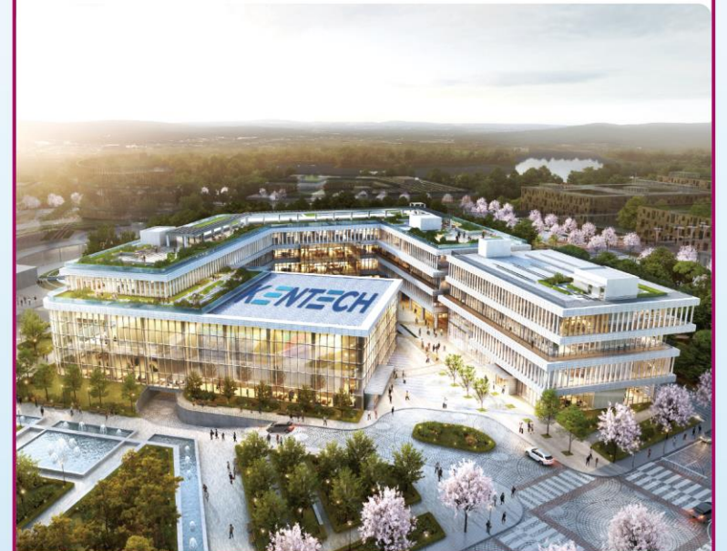
韓国エネルギー工科大学