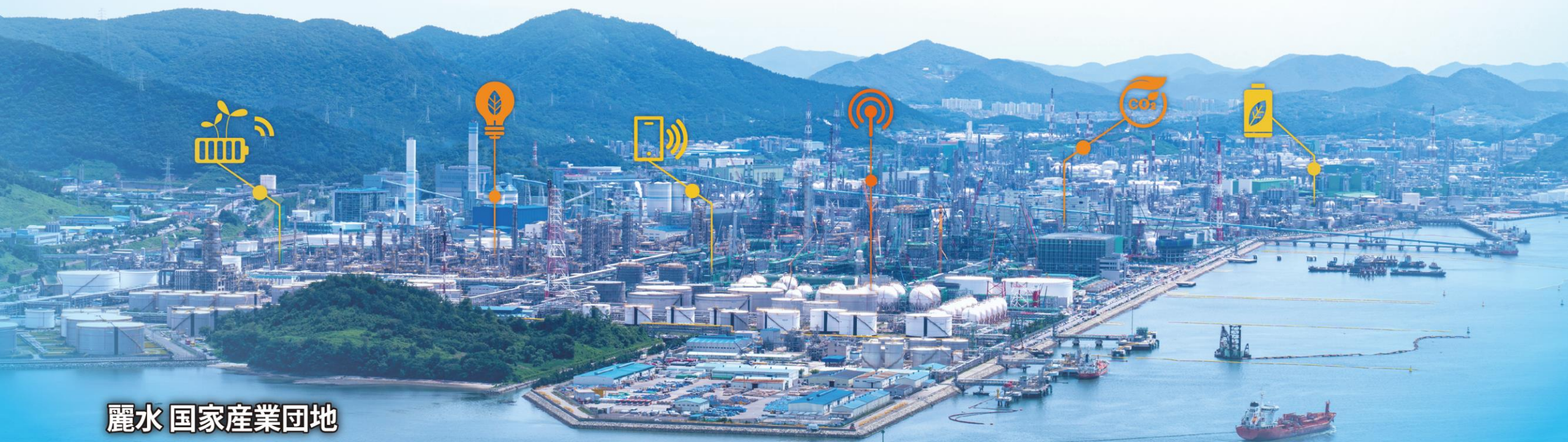
丽水 国家産業団地