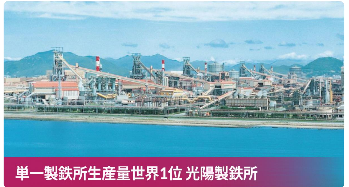
単一製鉄所生産量世界1位 光陽製鉄所