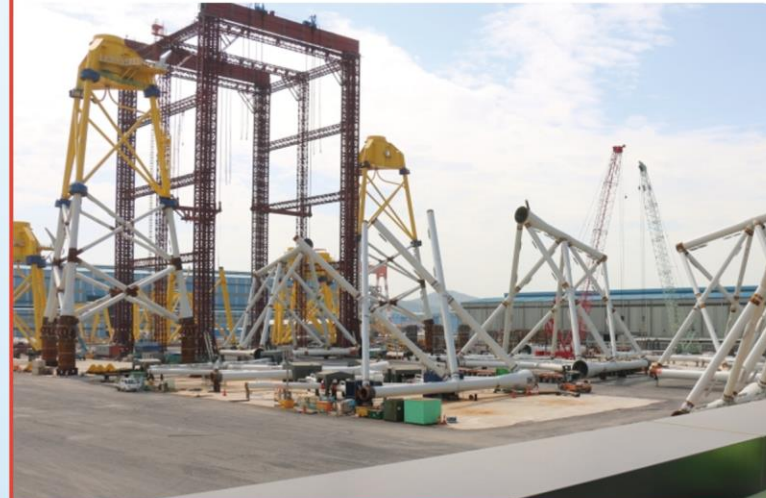
海上風力の機材・資材